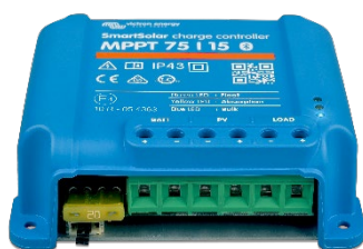
Controlador de carga SmartSolar MPPT 75/15