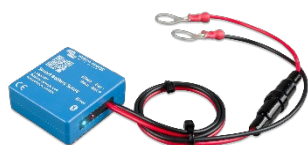
Detección de Bluetooth Smart Battery Sense