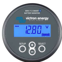
Detección de Bluetooth BMV-712 Smart Battery Monitor